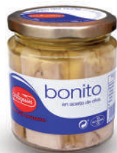
BONITO OLIVA, 220 G

8421993100843 0076 110 g/72 g 50 100 5 años Ambiente