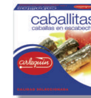
CABALLITAS ESCABECHE, 280 G

8421993912705 0156 260/182 g 24 54 5 años Ambiente