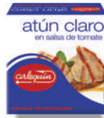
ATÚN CLARO TOMATE, 85 G

8421993909484 0110 80 g/56 g 100 72 5 años Ambiente