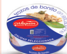
TROZOS EXTRA DE BONITO ESCABECHE, 1.800 G

8421993910275 0098 1.850 g/1.300 g 8 50 5 años Ambiente