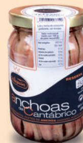
ANCHOA DEL CANTÁBRICO OLIVA, 250 G

8421993903680 0296 190 g/140 g 10 120 1 año Frío 25/35