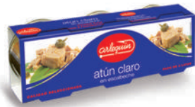
ATÚN CLARO ESCABECHE, 85 G PACK 3 UNIDADES

E. A. N. CÓDIGO PESO NETO/PESO ESCURRIDO UNIDADES/CAJA CAJAS/PALLET CADUCIDAD CONSERVACION N.º FILETES / N.º PIEZAS