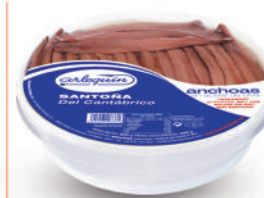
ANCHOAS DEL CANTÁBRICO OLIVA "0", 25 MARIPOSAS

8421993100560 0020 650 g/350 g 12 48 9 meses Frio 50