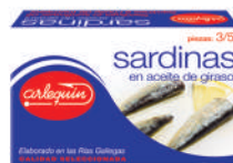
SARDINAS ACEITE, 3/5 PIEZAS, 125 G

8421993908906 0182 115 g/81 g 50 100 5 años Ambiente 3/5