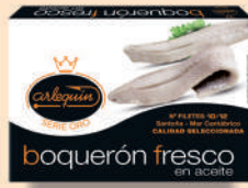
BOQUERÓN DEL CANTÁBRICO ACEITE, 120 G

E. A. N. CÓDIGO PESO NETO/PESO ESCURRIDO UNIDADES/CAJA CAJAS/PALLET CADUCIDAD CONSERVACIÓN N.º FILETES / N.º PIEZAS