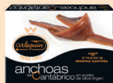
ANCHOA DEL CANTÁBRICO OLIVA "0", 12 FILETES

8421993905479 0325 120 g/58 g 12 200 9 meses Frio 8