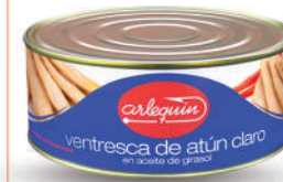
VENTRESCA DE ATÚN CLARO ACEITE, 900 G

8421993908319 0069 550 g/330 g 24 54 5 años Ambiente