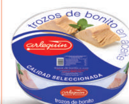
TROZOS EXTRA DE BONITO ACEITE, 1.800 G

842193100409 0096 1.850 g/1.300 g 8 50 5 años Ambiente