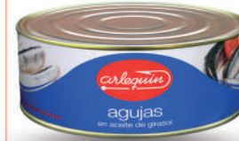
AGUJAS ACEITE, 900 G

8421993910008 0377 260 g/182 g 24 54 5 años Ambiente 8/10