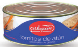
LOMITO DE ATÚN ACEITE, 900 G

8421993912880 0059 7.000 g/6.650 g 3 44 3 años Ambiente