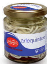
ARLEQUINITOS, 220 G

8421993007005 0227 215 g/150 g 12 168 5 años Ambiente