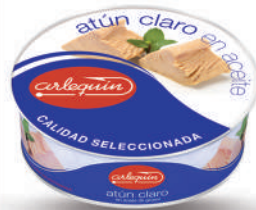
ATÚN CLARO ACEITE, ESPECIAL EMPAQUE A MANO, 1.800 G

8421993901549 0060 900 g/600 g 12 60 5 años Ambiente