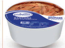
TROZOS DE ANCHOAS DEL CANTÁBRICO OLIVA, 900 G

8421993100560 0023 650 g/360 g 12 48 9 meses Frio 25 mariposas