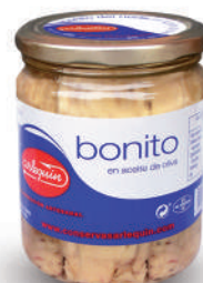
BONITO OLIVA, 400 G

8421993100096 0079 220 g/150 g 12 168 5 años Ambiente