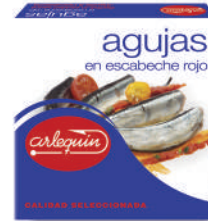
AGUJAS ESCABECHE ROJO, 280 G

8421993910015 0376 260 g/182 g 24 54 5 años Ambiente 8/10