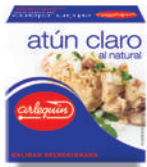
ATÚN CLARO NATURAL, 85 G

8421993908623 0109 77 g/52 g 100 72 5 años Ambiente