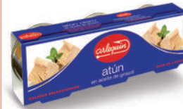
ATÚN ACEITE, 85 G PACK 3 UNIDADES

8421993310220 0112 77 g/52 g 100 72 5 años Ambiente