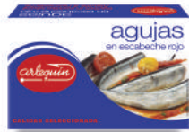
AGUJAS ESCABECHE ROJO, 125 G

8421993910046 0185 115 g/81 g 50 100 5 años Ambiente 5/7