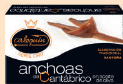
ANCHOA DEL CANTÁBRICO OLIVA, 90 G

8421993903659 0289 50 g/33 g 25 250 1 año Frío 8/9