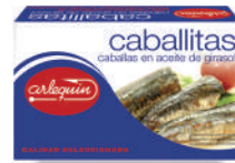
CABALLITAS ACEITE, 125 G

8421993990260 0148 900 g/600 g 12 60 5 años Ambiente