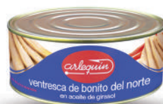
VENTRESCA DE BONITO ACEITE, 900 G

8421993910305 0091 900 g/600 g 12 60 5 años Ambiente