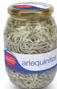
ARLEQUINITOS, 1.000 G

8421993100010 0231 230 g/110 g 12 168 5 años Ambiente