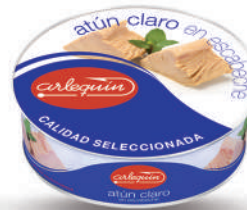
ATÚN CLARO ESCABECHE, ESPECIAL EMPAQUE A MANO, 1.800 G

8421993100430 0065 1.850 g/1.300 g 8 50 5 años Ambiente