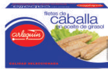
FILETES DE CABALLA ACEITE, 90 G

E. A. N. CÓDIGO PESO NETO/PESO ESCURRIDO UNIDADES/CAJA CAJAS/PALLET CADUCIDAD CONSERVACIÓN N.º FILETES / N.º PIEZAS