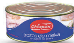
TROZOS EXTRA DE MELVA ACEITE, 900 G

8421993901082 0166 900 g/600 g 12 60 5 años Ambiente