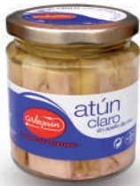
ATÚN CLARO OLIVA, 220 G

8421993911685 0127 110 g/72 g 50 100 5 años Ambiente