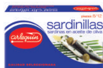
SARDINILLAS OLIVA, 8/12 PIEZAS, 90 G

E. A. N. CÓDIGO PESO NETO/PESO ESCURRIDO UNIDADES/CAJA CAJAS/PALLET CADUCIDAD CONSERVACIÓN N.º FILETES / N.º PIEZAS