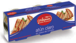
ATÚN CLARO TOMATE, PACK 3 LATAS 85 G

8421993908593 0119 80 g lata/56 g lata 40 72 5 años Ambiente