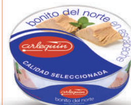
BONITO DEL NORTE ESCABECHE, 1.800 G

8421993100416 0094 1.850 g/1.300 g 8 50 5 años Ambiente