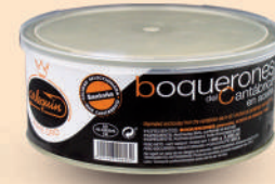
BOQUERÓN DE CANTÁBRICO ACEITE, "EASY PEEL", 1.000 G

8421993906025 0305 500 g/350 g 18 60 6 meses Frio 35/45