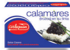
CALAMARES EN SU TINTA, 120 G

8421993906827 0216 115 g/72 g 50 100 5 años Ambiente