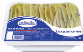
BOQUERONES DEL CANTÁBRICO VINAGRE SIN ALIÑAR, 700 G

8421993901983 0031 700 g/500 g 8 80 6 meses Frio 95/105