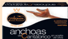
ANCHOA DEL CANTÁBRICO OLIVA, 50 G

E. A. N. CÓDIGO PESO NETO/PESO ESCURRIDO UNIDADES/CAJA CAJAS/PALLET CADUCIDAD CONSERVACIÓN N.º FILETES / N.º PIEZAS