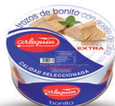
TROZOS EXTRA DE BONITO OLIVA, 900 G

8421993908470 0088 900 g/600 g 12 60 5 años Ambiente