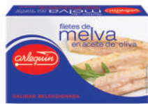
FILETES DE MELVA OLIVA, 125 G

E. A. N. CÓDIGO PESO NETO/PESO ESCURRIDO UNIDADES/CAJA CAJAS/PALLET CADUCIDAD CONSERVACIÓN N.º FILETES / N.º PIEZAS