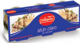
ATÚN CLARO NATURAL, 85 G PACK 3 UNIDADES

8421993908609 0120 77 g lata/52 g lata 40 72 5 años Ambiente