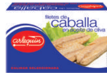
FILETES DE CABALLA OLIVA, 125 G

8421993908821 0137 85 g/57 g 50 100 5 años Ambiente