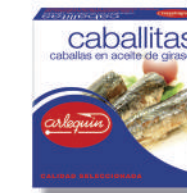
CABALLITAS ACEITE, 280 G

8421993912743 0154 115/81 g 50 100 5 años Ambiente