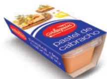
PASTEL DE CABRACHO, 170 G

E. A. N. CÓDIGO PESO NETO/PESO ESCURRIDO UNIDADES/CAJA CAJAS/PALLET CADUCIDAD CONSERVACIÓN N.º FILETES / N.º PIEZAS