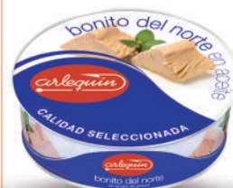
BONITO DEL NORTE ACEITE, 1.800 G

8421993913382 0105 900/600 g 12 60 5 años Ambiente