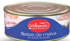
FILETES DE MELVA ACEITE, 900 G

8421993904885 0164 550 g/330 g 24 54 5 años Ambiente