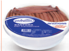
ANCHOAS DEL CANTÁBRICO OLIVA "00", 30 FILETES

8421993907374 0015 900 g/500 g 6 48 9 meses Frio 85/100