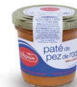
PATÉ DE PEZ DE ROCA (TIPO CABRACHO), 120 G

8421993007029 0237 205 g/180 g 12 168 5 años Ambiente