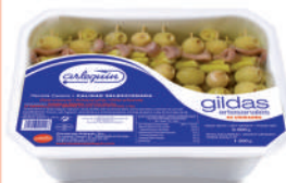
GILDA ARTESANAL DE ANCHOA EN ACEITE, 2.000 G (65 GILDAS)

8421993913351 0371 230 g/110 g 5 280 8 meses Frio 6