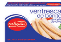
VENTRESCA DE BONITO OLIVA, 120 G

8421993500070 0082 415 g/270 g 12 100 5 años Ambiente