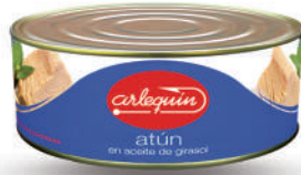
ATÚN ACEITE, 900 G

E. A. N. CÓDIGO PESO NETO/PESO ESCURRIDO UNIDADES/CAJA CAJAS/PALLET CADUCIDAD CONSERVACIÓN N.º FILETES / N.º PIEZAS