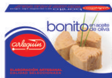
BONITO OLIVA, 120 G

E. A. N. CÓDIGO PESO NETO/PESO ESCURRIDO UNIDADES/CAJA CAJAS/PALLET CADUCIDAD CONSERVACIÓN N.º FILETES / N.º PIEZAS