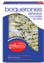
BOQUERONES DEL CANTÁBRICO ALIÑADOS OLIVA, 125 G

E. A. N. CÓDIGO PESO NETO/PESO ESCURRIDO UNIDADES/CAJA CAJAS/PALLET CADUCIDAD CONSERVACIÓN N.º FILETES / N.º PIEZAS