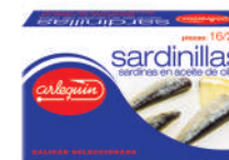
SARDINILLAS OLIVA, 16/22 PIEZAS, 125 G

8421993100751 0174 115 g/81 g 50 100 5 años Ambiente 10/14