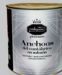
ANCHOAS DEL CANTÁBRICO EN SALAZÓN, 10 K

8421993913139 0387 5.000 g/4.000 g 4 50 2 años Frio 9/10 camada