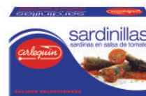
SARDINILLAS TOMATE, 90 G

8421993908630 0171 81 g/57 g 50 100 5 años Ambiente 8/12