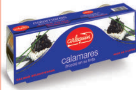
CALAMARES EN SU TINTA, 85 G, PACK 3 UNIDADES

8421993907107 0212 80 g lata/55 g lata 30 84 5 años Ambiente