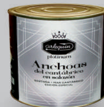
ANCHOAS DEL CANTÁBRICO EN SALAZÓN, 5 K

8421993913207 0385 400/210 g 15 48 9 meses Frio 24