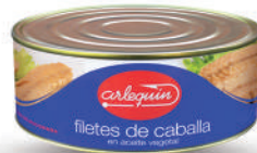
FILETES DE CABALLA ACEITE, 900 G

8421993904892 0146 523 g/330 g 24 54 5 años Ambiente