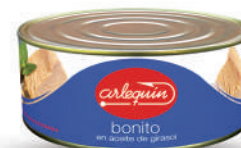
BONITO ACEITE, 900 G

8421993100584 0085 120 g/75 g 50 100 5 años Ambiente