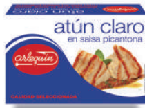
ATÚN CLARO EN SALSA PICANTONA, 120 G

E. A. N. CÓDIGO PESO NETO/PESO ESCURRIDO UNIDADES/CAJA CAJAS/PALLET CADUCIDAD CONSERVACIÓN N.º FILETES / N.º PIEZAS