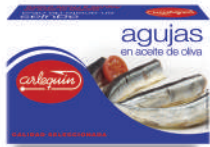
AGUJAS OLIVA, 125 G

E. A. N. CÓDIGO PESO NETO/PESO ESCURRIDO UNIDADES/CAJA CAJAS/PALLET CADUCIDAD CONSERVACIÓN N.º FILETES / N.º PIEZAS