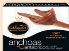
ANCHOA DEL CANTÁBRICO OLIVA "00", 8 FILETES

E. A. N. CÓDIGO PESO NETO/PESO ESCURRIDO UNIDADES/CAJA CAJAS/PALLET CADUCIDAD CONSERVACIÓN N.º FILETES / N.º PIEZAS