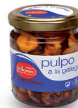
PULPO A LA GALLEGA ACEITE, 220 G

8421993100270 0234 930 g/630 g 6 60 5 años Ambiente