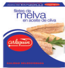
FILETES DE MELVA OLIVA, 550 G

8421993901457 0160 115 g/78 g 50 100 5 años Ambiente