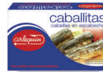
CABALLITAS ESCABECHE, 125 G

8421993912736 0152 115/81 g 50 100 5 años Ambiente