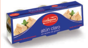
ATÚN CLARO ACEITE, 85 G PACK 3 UNIDADES

8421993911975 0113 77 g lata/52 g lata 40 72 5 años Ambiente