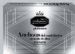
ANCHOAS DEL CANTÁBRICO OLIVA, 120 G

8421993912897 0283 120 g/58 g 12 100 1 año Frio 10/12