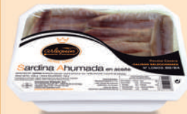
SARDINA AHUMADA, ACEITE, 28/32 LOMOS

8421993908043 0309 140 g/80 g 12 200 3 meses Frio 3/5