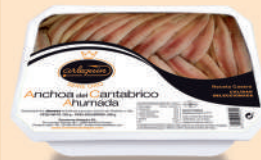
ANCHOA AHUMADA ACEITE, 55/65 FILETES

8421993908005 0312 1.000 g/700 g 8 50 3 meses Frio 28/32