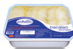
BACALAO AHUMADO EN ACEITE, 1.000 G

8421993911128 0049 2.000 g/1.200 g 4 60 8 meses Frio 50