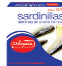
SARDINILLAS OLIVA, 25/30 PIEZAS, 280 G

8421993901822 0177 115 g/81 g 50 100 5 años Ambiente 16/22