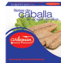
FILETES DE CABALLA OLIVA, 550 G

8421993908029 0144 270 g/175 g 24 54 5 años Ambiente