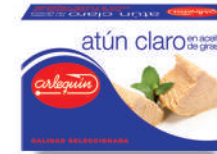
ATÚN CLARO ACEITE, 120 G

8421993910244 0122 110 g/72 g 50 100 5 años Ambiente