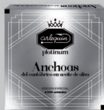
ANCHOAS DEL CANTÁBRICO OLIVA, 110 G

8421993912897 0283 120 g/58 g 12 100 1 año Frio 10/12