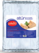
ATÚN ACEITE, BOLSA 1.000 G

8421993906865 0052 900 g/600 g 12 60 5 años Ambiente