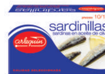
SARDINILLAS OLIVA, 10/14 PIEZAS, 125 G

84219931908722 0172 81 g/53 g 50 100 5 años Ambiente