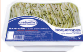
BOQUERONES DEL CANTÁBRICO ALIÑADOS OLIVA, 700 G

8421993901990 0029 195 g/150 g 8 160 6 meses Frio 35/40