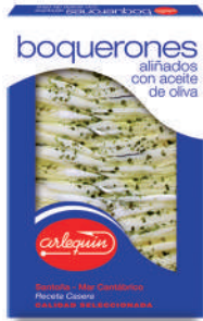
BOQUERONES DEL CANTÁBRICO ALIÑADOS OLIVA, 195 G

8421993902003 0027 125 g/80 g 12 160 6 meses Frio 20/25