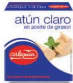
ATÚN CLARO ACEITE, 85 G

E. A. N. CÓDIGO PESO NETO/PESO ESCURRIDO UNIDADES/CAJA CAJAS/PALLET CADUCIDAD CONSERVACIÓN N.º FILETES / N.º PIEZAS