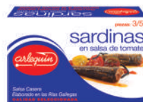
SARDINAS TOMATE, 3/5 PIEZAS, 125 G

8421993908852 0183 120 g/88 g 50 100 5 años Ambiente 3/5