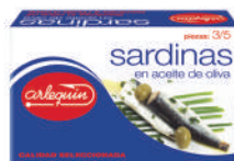
SARDINAS OLIVA, 3/5 PIEZAS, 125 G

8421993101086 0180 260 g/182 g 24 54 5 años Ambiente 25/30