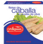
FILETES DE CABALLA OLIVA, 280 G

8421993902836 0140 120 g/90 g 50 100 5 años Ambiente