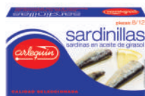
SARDINILLAS ACEITE, 8/12 PIEZAS, 90 G

8421993908739 0170 81 g/57 g 50 100 5 años Ambiente 8/12