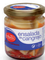
ENSALADA DE CANGREJO, 220 G

E. A. N. CÓDIGO PESO NETO/PESO ESCURRIDO UNIDADES/CAJA CAJAS/PALLET CADUCIDAD CONSERVACIÓN N.º FILETES / N.º PIEZAS