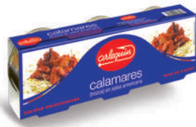
CALAMARES EN SALSA AMERICANA, 85 G, PACK 3 UNIDADES

E. A. N. CÓDIGO PESO NETO/PESO ESCURRIDO UNIDADES/CAJA CAJAS/PALLET CADUCIDAD CONSERVACION N.º FILETES / N.º PIEZAS