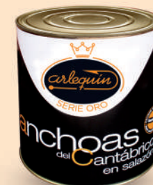
ANCHOA DEL CANTÁBRICO EN SALAZÓN, 10 K

8421993907572 0338 650 g/350 g 12 48 9 meses Frio 50