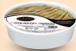
BOQUERÓN DEL CANTÁBRICO ACEITE, 700 G

8421993906315 0299 120 g/58 g 12 200 6 meses Frio 10/12