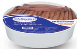
ANCHOAS DEL CANTÁBRICO OLIVA GRAN SELECCIÓN, 65/70 FILETES

E. A. N. CÓDIGO PESO NETO/PESO ESCURRIDO UNIDADES/CAJA CAJAS/PALLET CADUCIDAD CONSERVACIÓN N.º FILETES / N.º PIEZAS