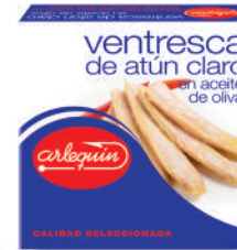
VENTRESCA DE ATÚN CLARO OLIVA, 550 G

8421993100423 0067 1.850 g/1.300 g 8 50 5 años Ambiente