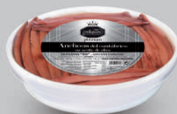
ANCHOAS DEL CANTÁBRICO OLIVA "00" 24 FILETES

8421993910985 0286 110 g/70 g 12 100 1 año Frio 12