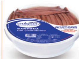
ANCHOAS DEL CANTÁBRICO OLIVA "00", 50 FILETES

8421993906810 0017 400 g/210 g 15 48 9 meses Frio 30