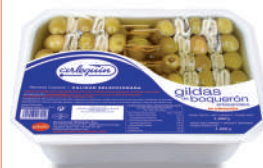
GILDA ARTESANAL DE BOQUERÓN EN ACEITE, 2.000 G (50 GILDAS)

8421993904298 0046 2.000 g/1.200 g 4 60 8 meses Frio 65