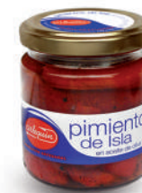
PIMIENTOS DE ISLA, 220 G

8421993002208 0235 230 g/140 g 12 168 5 años Ambiente