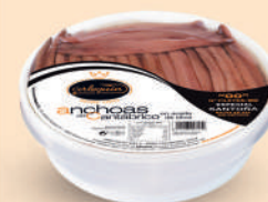
ANCHOA DEL CANTÁBRICO OLIVA "00" ESPECIAL, 50 FILETES

8421993907589 0335 400 g/210 g 15 48 9 meses Frio 30