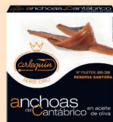
ANCHOA DEL CANTÁBRICO OLIVA, 200 G

8421993903673 0292 90 g/58 g 20 200 1 año Frío 14/15