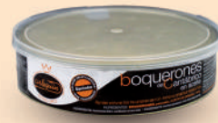
BOQUERÓN DEL CANTÁBRICO ACEITE, "EASY PEEL", 550 G

8421993907565 0302 600 g/300 g 12 40 6 meses Frio 40/45