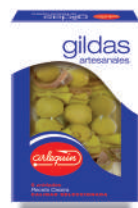
GILDA ARTESANAL DE ANCHOA EN ACEITE, 240 G (6 GILDAS)

8421993600169 0040 1.000 g 2 360 6 meses Frio