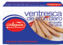
VENTRESCA DE ATÚN CLARO OLIVA, 125 G

8421993006008 0128 220 g/150 g 12 168 5 años Ambiente