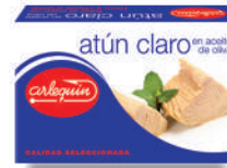
ATÚN CLARO OLIVA, 120 G

8421993910237 0121 77 g lata/52 g lata 40 72 5 años Ambiente