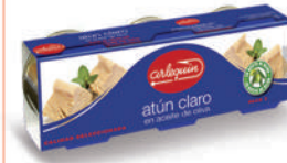
ATÚN CLARO OLIVA, 85 G PACK 3 UNIDADES

8421993901846 0115 77 g lata/52 g lata 40 72 5 años Ambiente