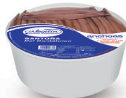
ANCHOAS DEL CANTÁBRICO OLIVA GIGANTE, 85/100 FILETES

8421993007449 0011 650 g/400 g 12 48 9 meses Frio 65/70