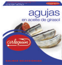
AGUJAS ACEITE, 280 G

8421993910053 0375 115 g/81 g 50 100 5 años Ambiente 5/7