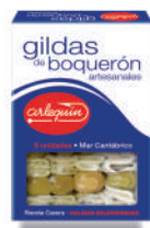
GILDA ARTESANAL DE BOQUERÓN EN ACEITE, 240 G (6 GILDAS)

8421993904267 0043 240 g/120 g 5 280 8 meses Frio 6