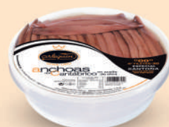
ANCHOA DEL CANTÁBRICO OLIVA "00" ESPECIAL, 30 FILETES

8421993906889 0328 120 g/58 g 12 200 9 meses Frio 12