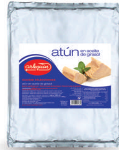
ATÚN ACEITE, BOLSA 7.000 G

8421993901884 0056 1.000 g/950 g 16 48 3 años Ambiente