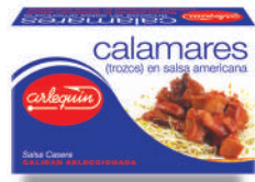
CALAMARES EN SALSA AMERICANA, 120 G

8421993907091 0214 80 g lata/55 g lata 30 84 5 años Ambiente