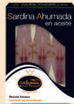
SARDINA AHUMADA, ACEITE, 3/5 LOMOS

8421993906032 0307 1.000 g/700 g 12 60 6 meses Frio 65/75