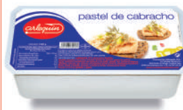
PASTEL DE CABRACHO, 1.000 G

8421993902034 0037 170 g 6 360 6 meses Frio