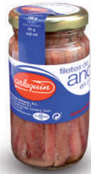
ANCHOAS DEL CANTÁBRICO OLIVA, 100 G

8421993008033 0001 50 g/29 g 25 250 1 año Frio 8/10