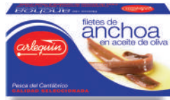
ANCHOAS DEL CANTÁBRICO OLIVA, 50 G

E. A. N. CÓDIGO PESO NETO/PESO ESCURRIDO UNIDADES/CAJA CAJAS/PALLET CADUCIDAD CONSERVACIÓN N.º FILETES / N.º PIEZAS